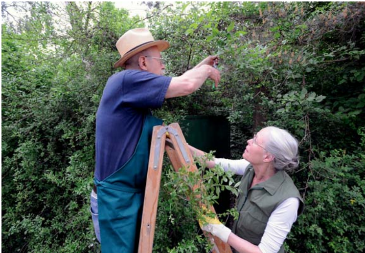
Vorsicht bei der Gartenarbeit! Die meisten Unfälle, die über 55-Jährige erleiden, passieren im Garten. (Quelle: GDV)